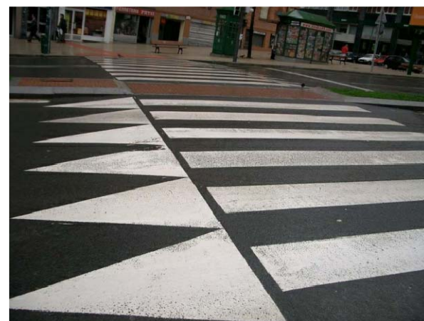
Elevación de la calzada por medio de badenes, abarcando todo el espacio del chafalán, de tal forma que exista continuidad peatonal desde las aceras a ambos lados de la calle, asegurando la accesibilidad.