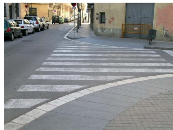
Achafanado de los bordillos en las intersecciones de los pasos peatonales, cumpliendo con las dimensiones mínimas y máximas pendientes que establece la normativa en materia de accesibilidad al medio físico urbano.

Las propuestas son orientativas y por tanto permiten modificaciones en función de las variaciones de sección de las vías urbanas u otros motivos, siempre y cuando cumplan con los objetivos planteados para el eje comercial estudiado.